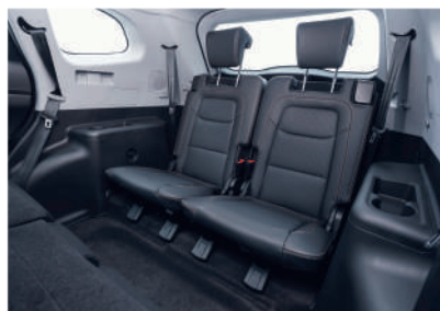
Продольная регулировка сидений 2-го ряда позволяет комфортно расположиться на 3-м ряду.