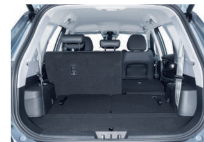
Вместительный багажник до 1 930 литров.