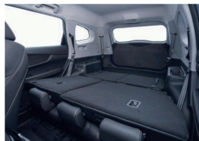
Сложенные сидения 2-го и 3-го ряда образуют ровную площадку 1.5x2 метра.