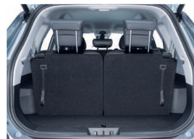
Функциональный багажник даже при путешествии всемером.