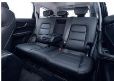
Кожаный 7-местный салон от LEAR*.